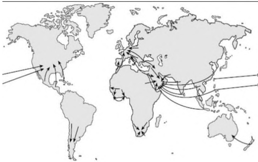
Рис.2. Основные миграционные потоки

Задание 5. Сделайте общий вывод по работе (чему учились?).