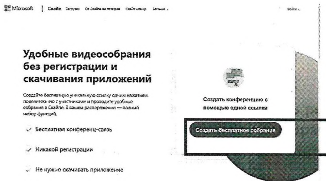
Рисунок 1. Создание уникальной ссылки

Шаг 2. Создайте бесплатную уникальную ссылку нажимаем на кнопку «Создать бесплатное собрание» (рис .1)